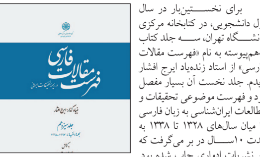
برای نخستین‌بار در سال

اول دانشجویی، در کتابخانه مرکزی دانشگاه تهران، سه جلد کتاب به‌هم‌پیوسته به نام «فهرست مقالات فارسی» از استاد زنده‌یاد ایرج افشار دیدم. جلد نخست آن بسیار مفصل بود و فهرست موضوعی تحقیقات و مطالعات ایرانی‌شناسی به زبان فارسی را میان سال‌های ۱۳۳۸ تا ۱۳۳۸ به مدت ۱۰۱سال در بر می‌گرفت که در نشریات ادواری چاپ شده بود.