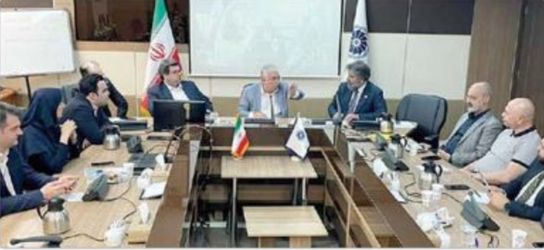
جلسه معارفه کاندیدای ریاست اتاق بازرگانی ایران در تهران برگزار شد.